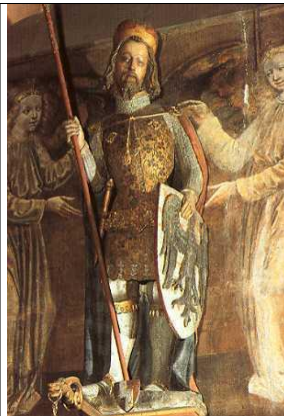
SOCHA SV. VÁCLAVA VE SVATOVÁCLAVSKÉ KAPLI PRAŽSKÉ KATEDRÁLY

Důvěra – Svatý Václav měl důvěru ve své lidi a obracel se k nim se svými problémy. Naučme se také důvěřovat a vytvářet silné vztahy s lidmi kolem nás.